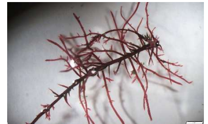
実験最終日の PES 試験区の個体

以上を踏まえ、今後は人工海水下でのマクサの成熟誘導の実現を図り、種苗生産技術の確立に向け研究を進展させていく所存である。