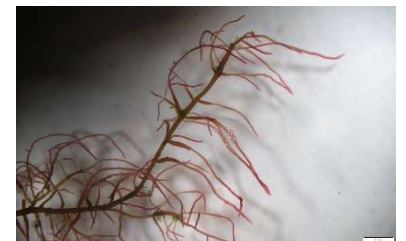
実験最終日の NaNO 3 -試験区の個体