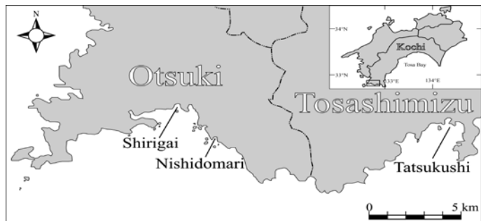
図1. 高知県大月町尻貝と西泊、土佐清水市竜串の位置 Figure 1. Location map of Shirigai, Nishidomari (Otsuki Town) and Tatsukushi, Tosasimizu City, Kochi Prefecture, Japan.

群体を円形と仮定して投影面積から群体のそれぞれの推算半径を算出し成長の指標とすると、本群体の推算半径による成長速度は 38 \text{ mm/year} であった。林・岩瀬(2010)では、大月町西泊(図1)において有性生殖で生産され移植された2群体のクシハダミドリイシ Acropora hyacinthus (Dana, 1846)の推算半径による成長速度は、 49 \text{ mm/year} と 31 \text{ mm/year} で平均 40 \text{ mm/year} と報告している。今回の Acropora sp. 群体