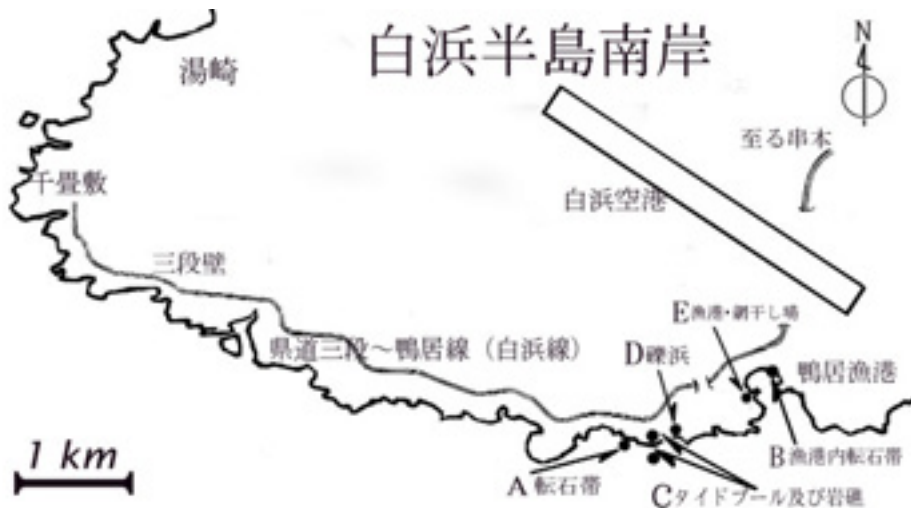
図1. オニヒトデ調査を実施した和歌山県西牟婁郡白浜町の鴨居漁区海岸の5箇所(A-E地点)

上記に加え、(4) 2002年6月から2010年1月まで、1月～2月の各日曜日にC地点から北東方向に約50mの所にある礫浜(図1, D地点)で漂着物調査を実施した(新稲・久保田 2009)。なお、C・D地点への入り口は、私有地によって塞がれており、両地点へは他の人間は容易にはアクセスできない。さらに、(5) 2005年2月～2010年1月の間に、鴨居漁港内の網干し場(図1, E)で漁労屑の調査を週に一度と定期的に行なった。以下に示す結果より、上記の調査場所はA-E地点として省略して記す。