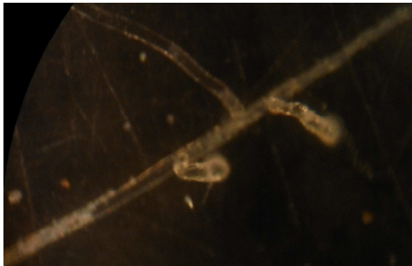
図 2. 瀕死状態の 13 回若返ったベニクラゲのポリプ（沖縄産群体の一部を 2015 年 7 月 23 日撮影）

それから約 1 ヶ月経過した 2015 年 6 月 15 日には、かろうじて生残していたイスラエル産 1 群体も消滅した。ようやく生残できたのが白浜産 3 群体と沖縄産 3 群体であった。これらのどの群体も全個虫が小さく、群体を構成する総個虫数も極端に少なく、平均するとわずか数個虫であった（最小数は 1）。これら 6 群体は再生し始めていたにもかかわらず、またしても 7 月中旬の大雨時に衰弱した。ポリプの触手がまず消失し、ヒドロ花やヒドロ茎が消失した。しかし、囲皮は残存していたが、7 月 22 日には終にヒドロ茎の囲皮も消失し、死亡直前の状態に陥って（図 2）、その後ヒドロ根の肉質部も消失し完全消滅した。